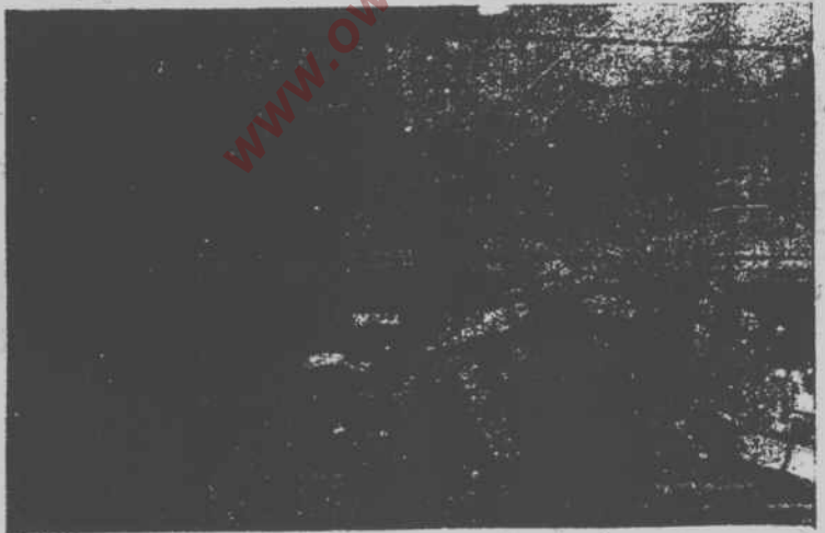
35 ایرانی نژادوں میں سے ایک نژاد جو اسٹور سے بھر اہوا ہے ان نژادوں کے 35 ذرائع بھی مقرر کرنے چاہئے ہیں، تاکہ وہ سب ملامت کے سامنے ایک انٹرویو میں ان ذرائعوں سے یہ اعتراف کیا ہے کہ وہ یہ نژاد ایرانی سے لائے گئے