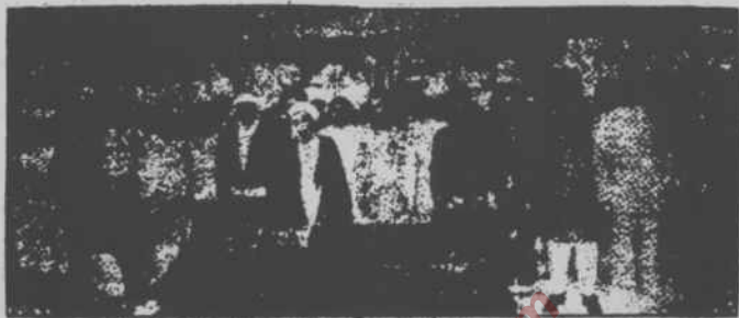
غفور احمد اور نائب امیر محمد طفیل کے نماز جنازہ ادا کرنا (پہلے)

سائق امیر جماعت اسلامی میان طفیل محمد اور نائب امیر پروفیسر غفور احمد کا موڈودی صاحب کے فتویٰ پر عمل دونوں شیعہ میت کا شیعہ امام کے پیچھے ہاتھ کھولے اور یوں اپنے نماز جنازہ ادا کر رہے ہیں۔