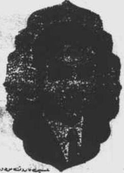
حسرت نارت کے سردار