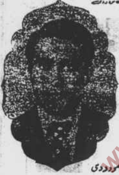
محمد نازق مودودی