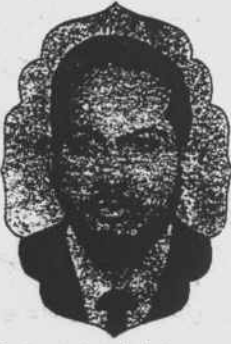
عسکارت کے سردار

قارئین محترم! نام نہاد مفکر اسلام نے اپنی اولاد کا جو حشر کیا اس کا نمونہ روزنامہ "جسارت" کی خصوصی اشاعت "مودودی نمبر" کی زیر نظر تصاویر میں ملاحظہ فرمائیں: