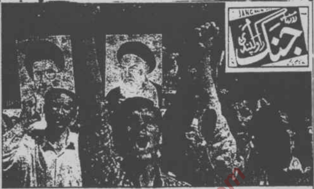
تہران یونیورسٹی کے طلبہ طالبان کے خلاف مظاہرے میں پاکستان کے خلاف نعرے لگا رہے ہیں

”پاکستان“ کو ایرانی دھمکیوں پر روزنامہ ”وصاف“ نے مورخہ ۲۰ ستمبر ۱۹۹۸ء کو درج ذیل ادارہ لکھا