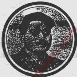
مودودی صاحب ۱۹۲۳ء میں