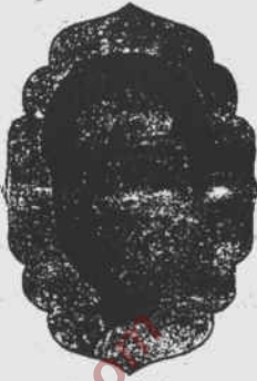
اسلام آباد کے سردار